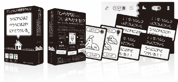
図1 「うらにわには2わうらには2わにわとりがいる。」

本作品は2020年に制作した、日本の早口言葉である「うらにわにはにわにわにはにわにわとりがいる」をもとにした、2人以上用のカルタゲームである[図1]。