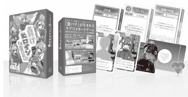
図5 「負けヒロインとは言わせない！！」

本作品は 2022 年に制作した、ラブコメジャンルの 2~6 人用のパーティゲームである[図5]。