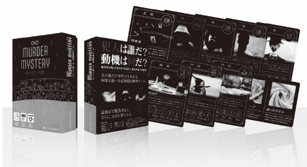
図4 「∞MURDER MYSTERY ~終わらない物語~」

本作品は 2020 年に制作した、「マードーミステリー」という人気のジャンルをもとにした 4~7 人用の正体隠匿・推理ゲームである[図4]。