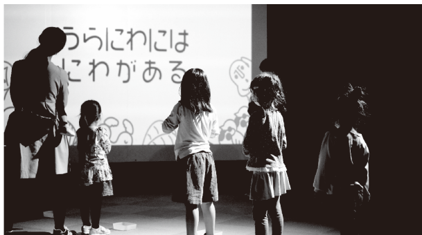
図2 プレイ中の写真

また、本作品は、愛知県児童総合センター主催の「汗かくメディア」プログラム2021の公募にて最優秀賞を受賞し、空間と身体を使った遊び「うらにわには 2 わうらには 2 わにわとりがいる:3D」として発展させ、発表を行った[図2][図3]。